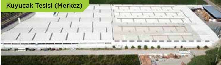
Kuyucak Tesisi (Merkez)