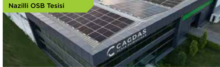
Nazilli OSB Tesisi