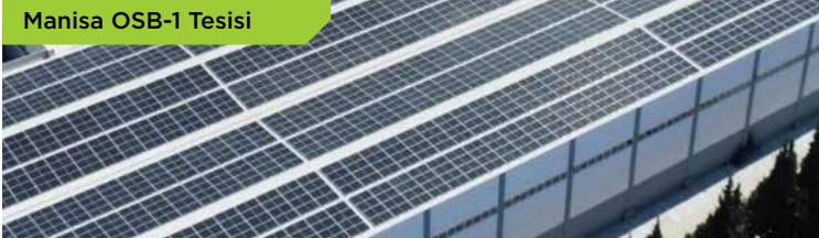
Manisa OSB-1 Tesisi