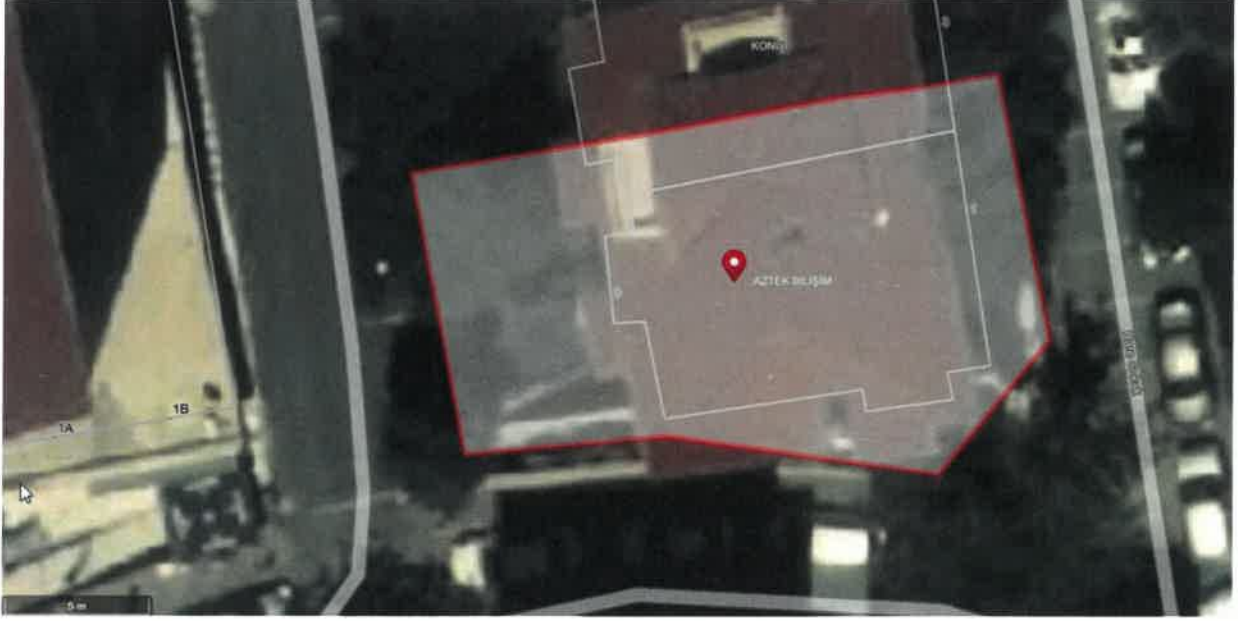
Taşınmazın Konum Şeması