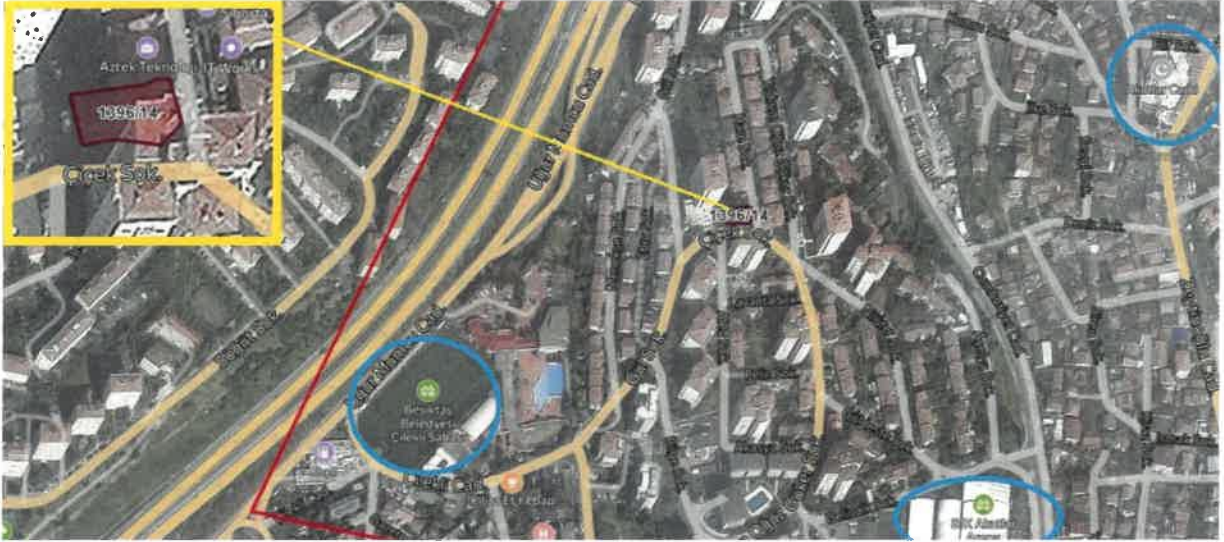
Taşınmazın Konum ve Ulaşım Bağlantıları

Nispetiye Caddesi üzerinden Rumeli Hisarı – Beşiktaş istikametinde ilerlerken Akmerkez AVM geçildikten sonra sağ taraftan Meydan Caddesi'ne dönülür. Cadde devamı olan Ebulula Mardin Caddesi'ne geçilerek yaklaşık 710 metre düz devam edildikten sonra sağ taraftan Yıldırım Oğuz Göker Sokak'a dönülür. Sokak sonundan sol taraftaki Çiçek Sokak'a ve ilk sağdan Hare Sokak'a giriş yapılarak mülke erişim sağlanabilmektedir. Değerlemeye konu mülkün içinde bulunduğu 14 parsel sol tarafta kalan ilk parsel olup köşede başıdır.