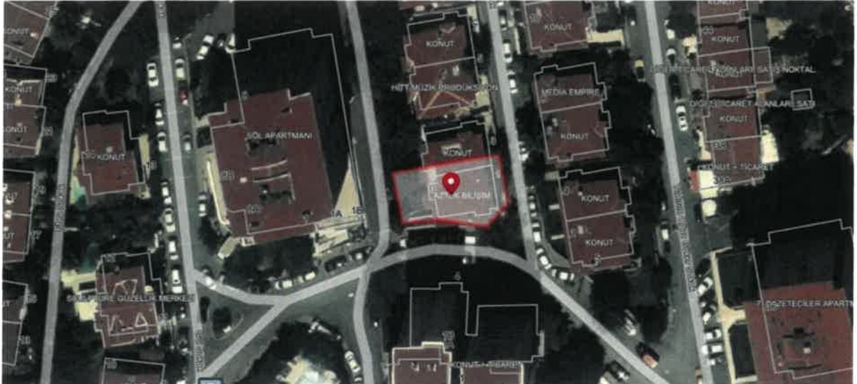
Taşınmazın Konumu